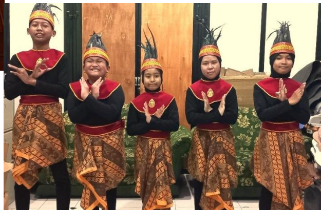
danskleding voor 10 kinderen