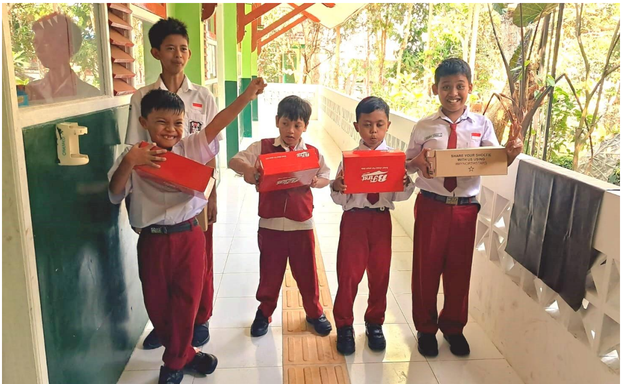
De jongens van Idayu 2 zijn heel blij met hun nieuwe schoenen.

Een financieel overzicht van alle inkomsten is terug te vinden op pagina 14.