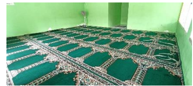
vloerbedekking voor gebedsruimte