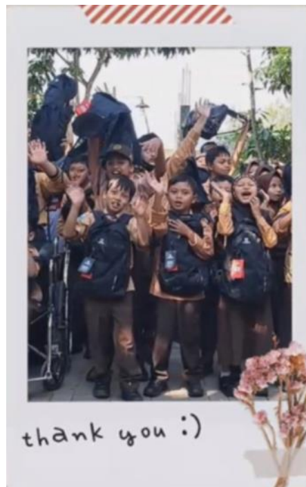
schooltassen voor 50 kinderen van Idayu 2