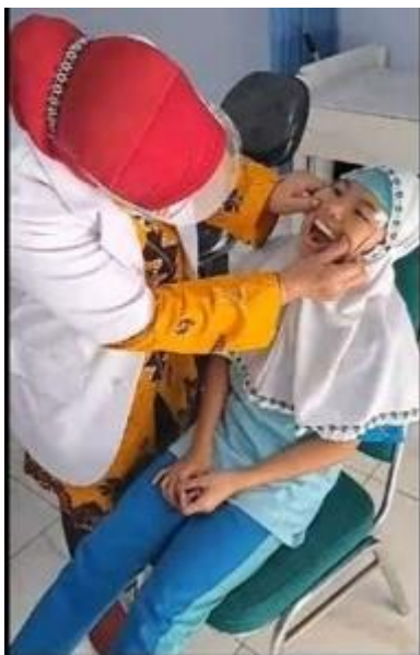
45 kinderen zijn gecontroleerd door de tandarts.

Zoals ieder jaar heeft de stichting ook in 2023 weer een bedrag gegeven voor extra voeding. Net zoals in Nederland zijn de levensmiddelen in Indonesië ook duurder geworden. Het geld wordt onder andere besteed aan olie, rijst en vlees. Elk jaar krijgen de personeelsleden een attentie tijdens het Suikerfeest voor het goede werk dat zij verrichten voor de kinderen.