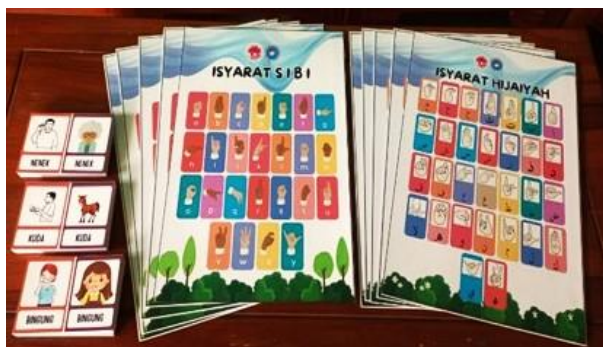
De school heeft leermiddelen kunnen aanschaffen.