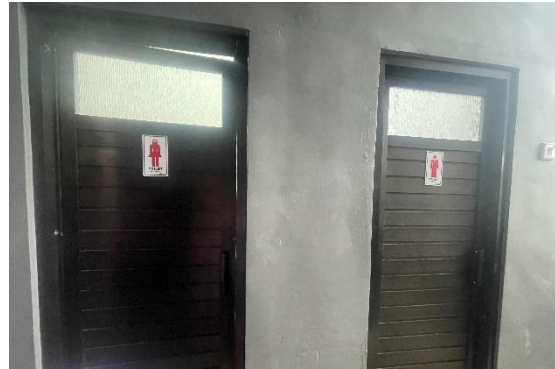
de gang en toiletdeuren

Het restant bedrag van de verbouwing mochten ze uitgeven voor het aanschaffen van schoolspullen voor de kinderen