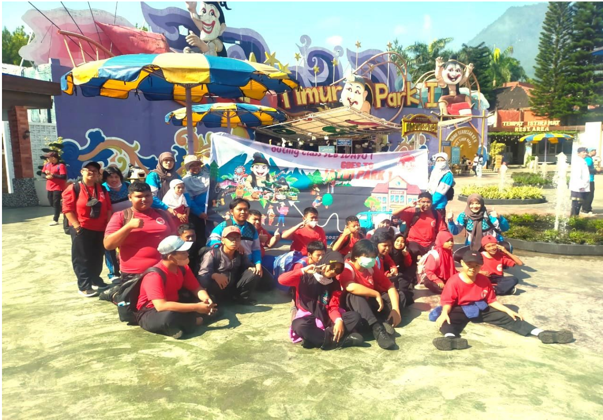
uitje naar Jatim Park voor 35 kinderen, gesponsord door Club de Petanque Boule Plaisir Uitgeest

Idayu 1 is een kleine school voor kinderen met diverse beperkingen, die les krijgen op hun eigen niveau. Er was een verzoek binnen gekomen om handarbeidartikelen, muziek-instrumenten en danskleding. We vinden het heel belangrijk om de creatieve geest te stimuleren, dus deze verzoeken hebben we ingewilligd. Naast praktische zaken zoals extra voeding en schoolgeld wilden ze graag naar een pretpark. De kinderen hebben met hun begeleiders een prachtige dag gehad. Ze hebben genoten.