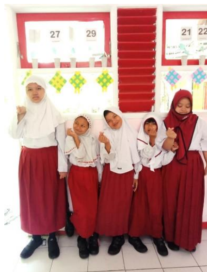
De meisjes van IDAYU 2 zijn blij met hun nieuwe schoenen.

De stichting heeft sinds 2007 de ANBI-status. De stichting voldoet aan de eisen die hiervoor door de belastingdienst zijn gesteld.