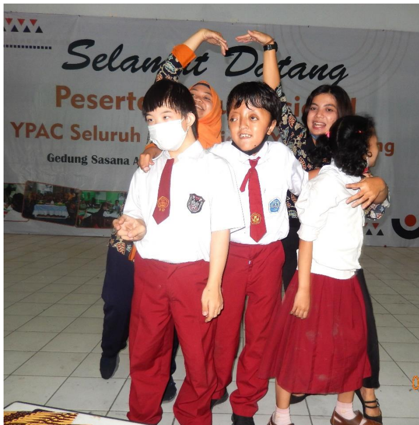
een dansje bij het jubileum van YPAC

Kan alleen roepen vanuit ervaring. Ga zo door en ik hoop dat vele sponsoren/donaties nog zullen volgen. Uw donatie komt goed terecht.