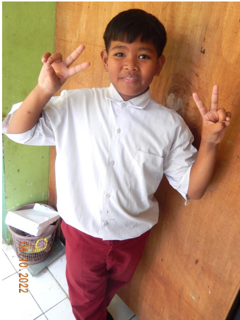
leerling van IDAYU 2

Een financieel overzicht van alle inkomsten is terug te vinden op pagina 16.